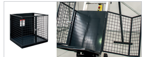
STANDARDNÍ KLEC 500×600×700 mm