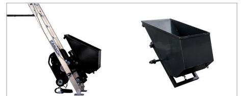
AUTOMATICKÝ KONTEJNER 70 l