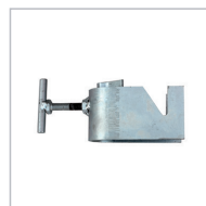
SPONA PRO UCHYCENÍ K LEŠENÍ