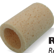
RUBINET® Ref. 62955