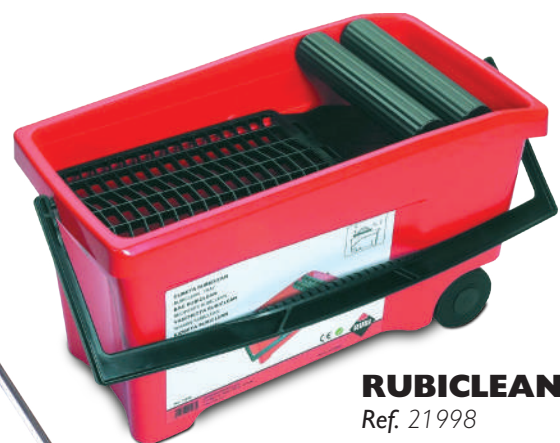
RUBICLEAN Ref. 21998