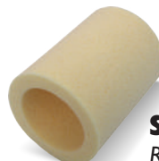
SWEEPEX® Ref. 62956