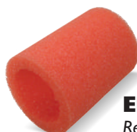
EPOXI Ref. 62957